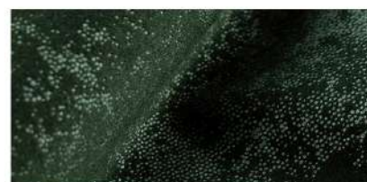
Suffle bottle green