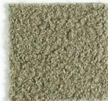
BARNI Dusty green